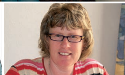
33 | Organisatorin mit Kopf, Herz und Hand