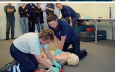
04 | Erfahrungen im Kampf gegen den Herztod