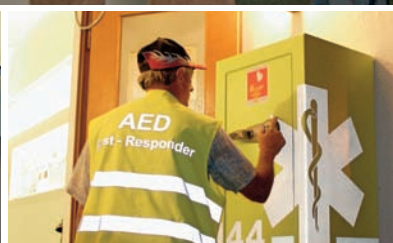
12 | Samariter als First-Responder