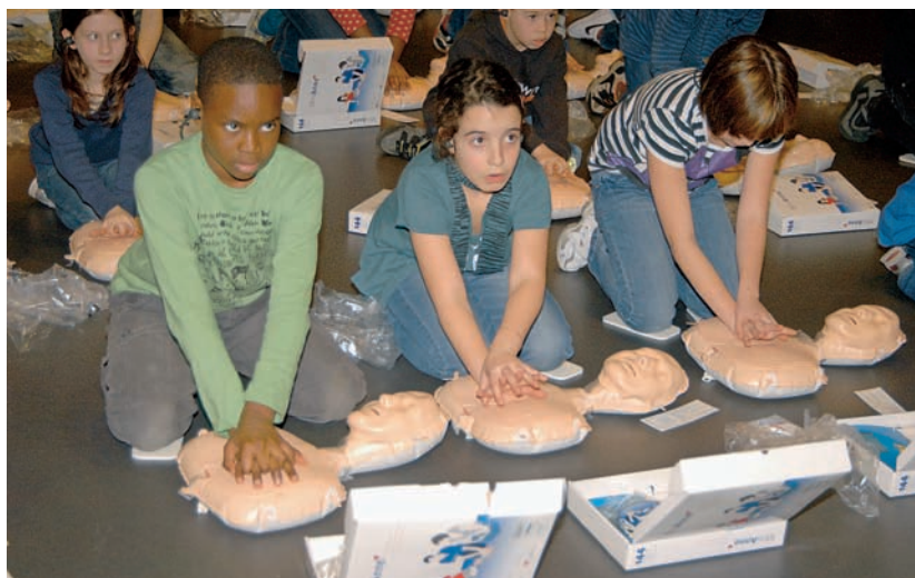
Konzentriert folgen die Schülerinnen und Schüler den Vorgaben des Lernprogramms.